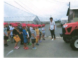
2年生 野菜研究所へ