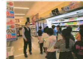
3年生 マエダストアへ