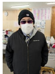
↑校内に侵入した不審者